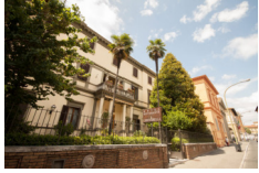
Hotel Chiusarelli - Siena www.chiusarelli.com

Pernottamenti in camera doppia in hotels **/***, B&B e agriturismi con prima colazione