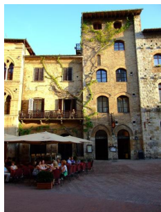
Hotel La Cisterna - San Gimignano