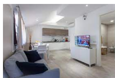
Bed&Bike - Aulla