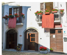
B&B La Casa dei Nonni - Berceto