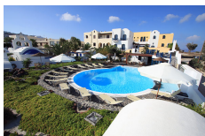
Kalimera Hotel - Santorini