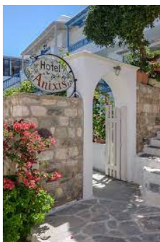
Hotel Anixis - Naxos

7 pernottamenti in Pernottamento e Prima Colazione (3 notti di Naxos, 4 notti a Santorini)