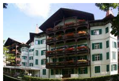
Residence Gasser - Bressanone

In questo viaggio non è previsto il trasporto bagaglio.