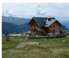
Rifugio Resciesa - Ortisei