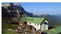
Rifugio Genova - Funes