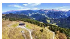
Rifugio Monte Muro - San Martino in Badia