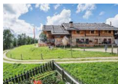
Rifugio Kreuzwieser Alm - Lusen