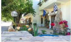
Hotel Neos Omalos - Omalos www.neos-omalos.gr