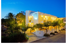
Hotel Aris - Paleochora www.arishotel.gr

Pernottamenti in camera doppia in hotel ***