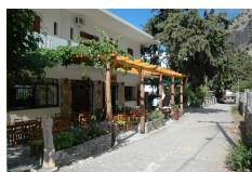
B&B Pachnes Pension - Agia Roumeli