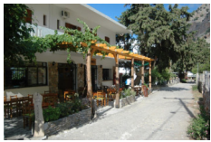
B&B Pachnes Pension - Agia Roumeli www.pachnes.gr