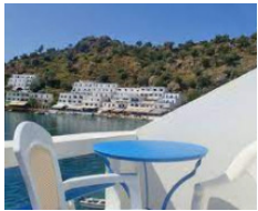
Hotel Kyma - Loutro http://kyma.com.es/