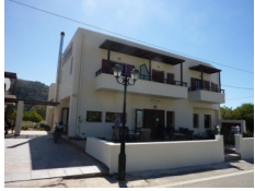
Hotel Syia - Sougia www.syiahotel.com