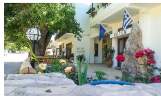
Hotel Neos Omalos - Omalos