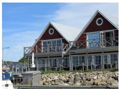
Bryggan Hotell, Hoganas http://www.hoganasbrygga.se/