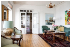
Strand Hotel, Arild http://www.strand-arild.se/