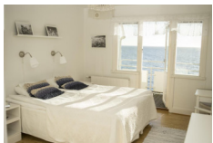
Pensionat Strandgarden, Molle https://pensionat-strandgarden-molle.hotelmix.it/