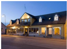
Hotell Köpmansgården, Hoganas https://www.kopmansgarden.se/