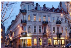
Hotel Linnea, Hoganas http://www.hotell-linnea.se/