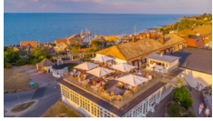
Rusthållaregården, Arild http://www.rusthallargarden.se/