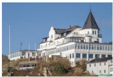
Grand Hotel Olympia, Molle https://www.grandhotelmolle.se/