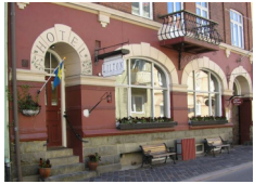
Hotel Lilton, Angelholm http://www.hotel-lilton.se/

Il prezzo include sistemazione in camera doppia / twin condivisa in boutique hotels e b&b, in camera con bagno privato.