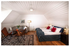
Kullagårdens Wårdshus, Molle https://www.kullagardenswardshus.se/