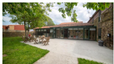
Casa Do Acivro - O Pino https://oacivro.com/?lang=en