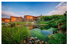
Pazo de Santa Maria - Arzua www.pazosantamaria.com