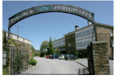
Pousada de Portomarin - Portomarin https://www.pousadadeportomarin.es/