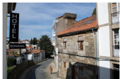
Hotel Ada Bonaval - Santiago de Compostela https://aldahotels.es/alojamientos/hotel-alda-bonaval-santiago/