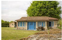
A Parada das Bestas - Palas de Reis https://aparadadasbestas.com/en