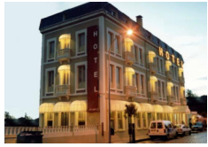
Hotel Restaurante Roma - Sarria https://hotelroma1930.es/

6 pernottamenti in camera doppia in hotels **/***, B&B e agriturismi con prima colazione.