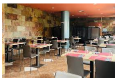
Estella – Hotel Yerri