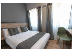
Pamplona – Alda Pamplona Centro