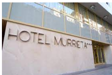
Logroño – Hotel Murrieta