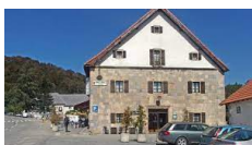
Roncesvalles – Posada de Roncesvalles

Una selezione di sistemazioni diverse, che vanno dai tradizionali hotel di paese, pensioni rurali, gli affascinanti e confortevoli hotel rurali, in camere con bagno privato.