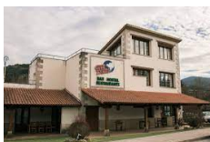
Zubiri – Hosteria de Gautxori