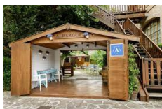
Puente la reina – Hotel Jakue