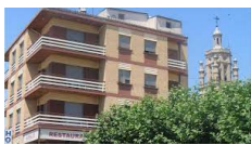
Los Arcos – Hotel Monaco