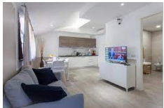
Bed&Bike - Aulla https://bedebike.it