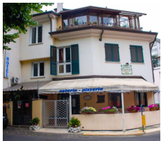
Hotel Annunziata - Massa www.hotelannunziata.com