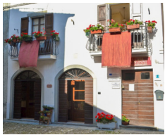
B&B La Casa dei Nonni - Berceto www.lacasadeinonniberceto.it