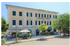
Hotel Rex - Lucca www.hotelrexlucca.com