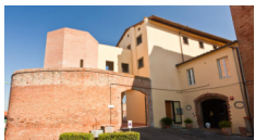
Hotel San Miniato - San Miniato www.hotelsanminiato.com