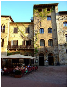
Hotel La Cisterna - San Gimignano https://www.hotelcisterna.it