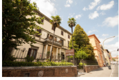
Hotel Chiusarelli - Siena www.chiusarelli.com

Pernottamenti in camera doppia in hotels **/***, B&B e agriturismi con prima colazione