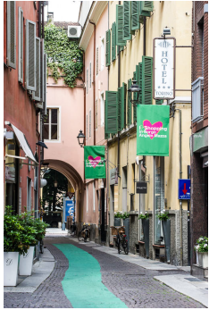
Hotel Torino - Parma www.hotel-torino.it