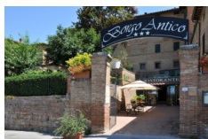
Hotel Borgo Antico - Lucignano

L'albergo si trova nel centro delle Crete Senesi, immerso in un'atmosfera tranquilla e piacevole. Le camere piccole, ma pulite, sono curate in tutti i minimi particolari mantenendo lo stile tipico Toscano con travi e rifiniture in legno e da alcune è possibile ammirare il paesaggio toscano. Offrono WiFi gratuita, aria condizionata, TV.