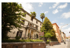
Hotel Chiusarelli - Siena

Due pernottamenti in camera doppia in hotels *** ,B&B e agriturismi con prima colazione