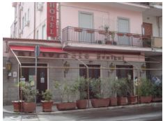
Hotel Benigni - Campagnano www.hotelbenigni.it