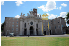
Hotel Domus Sessoriana - Roma www.domussessoriana.com