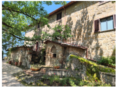
La Locanda della Chiocciola - Orte www.lachiocciola.net

Pernottamenti in camera doppia in hotels **/***, B&B e agriturismi con prima colazione