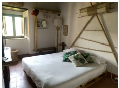
Opera Suites - Calcata www.operacalcata.com