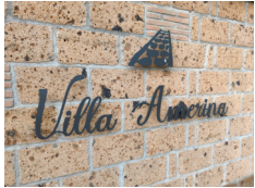
Agriturismo Villa Amerina - Corchiano