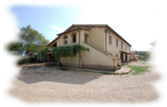
BioBagnolese Agriturismo - Castel Bagnolo www.biobagnolese.it