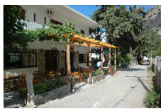
B&B Pachnes Pension - Agia Roumeli www.pachnes.gr