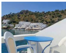
Hotel Kyma - Loutro http://kyma.com.es/