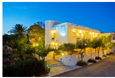
Hotel Aris - Paleochora www.arishotel.gr

Pernottamenti in camera doppia in hotel ***