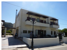
Hotel Syia - Sougia www.syiahotel.com