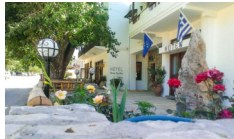
Hotel Neos Omalos - Omalos www.neos-omalos.gr