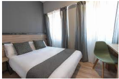
Pamplona – Alda Pamplona Centro https://aldahotels.es/alojamientos/hotel-alda-centro-pamplona