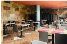
Estella – Hotel Yerri http://www.hotelyerri.es