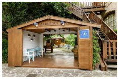
Puente la reina – Hotel Jakue https://www.jakue.com