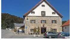
Roncesvalles – Posada de Roncesvalles https://laposada.roncesvalles.es

Una selezione di sistemazioni diverse, che vanno dai tradizionali hotel di paese, pensioni rurali, gli affascinanti e confortevoli hotel rurali, in camere con bagno privato.