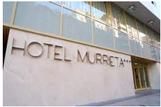
Logroño – Hotel Murrieta https://hotel-murrietalogrono.com