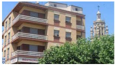
Los Arcos – Hotel Monaco http://www.hotelmonaco.es