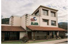
Zubiri – Hosteria de Gautxori https://hostalgautxori.com